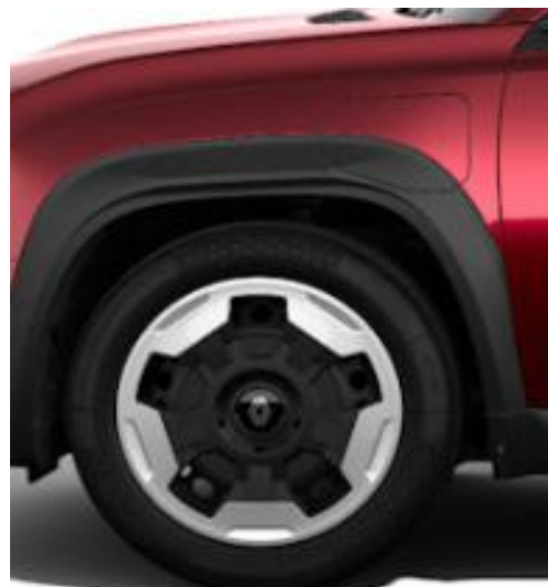
Τροχοί 18" "jogging" με δίχρωμο κάλυμμα & ελαστικά 195/60 R18