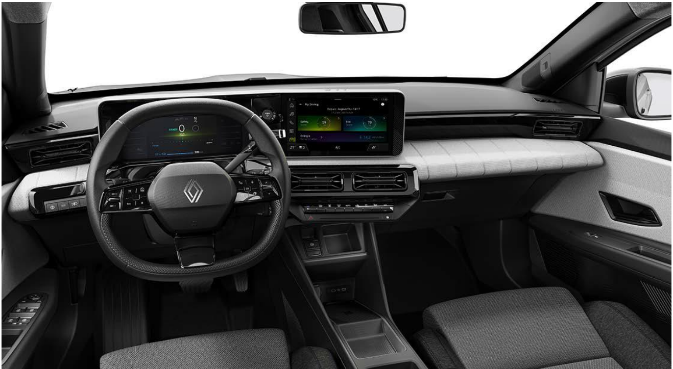
Ψηφιακός πίνακας οργάνων 7" & Σύστημα πολυμέσων openR link 10,1"