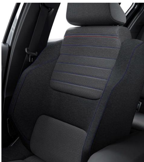
Υφασμάτινες επενδύσεις εμπρός καθισμάτων σε γκρι χρώμα με μπλε, λευκές και κόκκινες διακοσμητικές ραφές