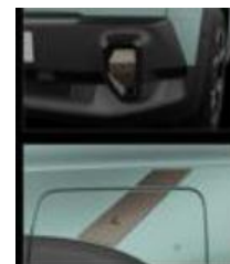
Διακοσμητικά αυτοκόλλητα προφυλακτήρων & εμπρός φτερών numbeR4 cooper