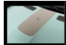
Διακοσμητικό αυτοκόλλητο καπό & οροφής numbeR4 cooper